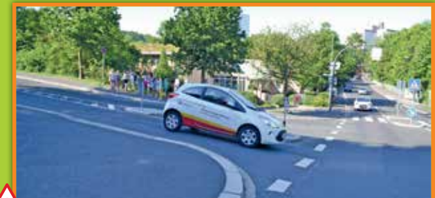
2 Überquerung der Frankenstraße: (von Ostpreußenstraße zur Hessenstraße)

Gefahrenstelle: Fußgänger überqueren die Straße, um zur Tankstelle zu gelangen, ohne geregelten Übergang Gefahr: viel Verkehr, Sichtbehinderung durch parkende Fahrzeuge