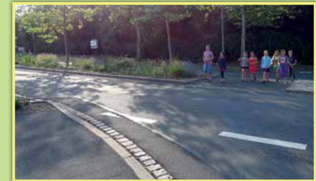
3 Übergang Heuchelhofstraße Richtung Prager Ring - Haltestelle Athener Ring ohne Ampel und ohne Zebrastrreifen über Verkehrsinseln