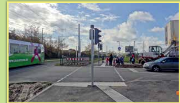
2 Nutzung des neuen Weges vom Wiener Ring zum Mwanza-Weg entlang der Straßenbahngleise