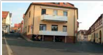
4 Kreuzung Steigstraße - Estenfelder Straße

Uneinsichtige Kreuzung zum Teil ohne begehbare Gehsteige Vermeide die Überquerung der Steigstraße von der Estenfelder Straße kommend ganz!