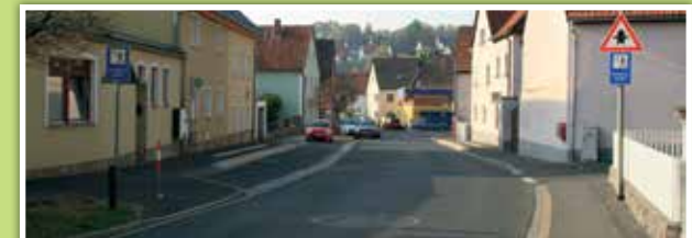
3 Querung Estenfelder Straße auf Höhe der Kühlenbergstraße

Uneinsichtige Kreuzung zum Teil ohne begehbare Gehsteige Vermeide die Überquerung der Steigstraße von der Estenfelder Straße kommend ganz!