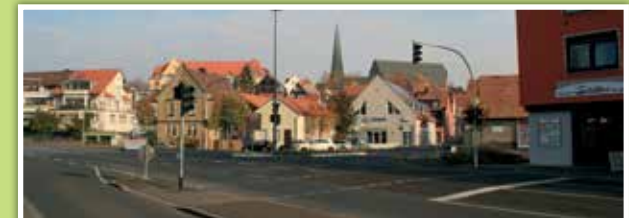
2 Kreuzung Versbacher Straße Querung vor der Bäckerei Schiffer

Straßenüberquerung ohne Gehsteige Vorsicht, viel Verkehr und keine Gehsteige! Nur wenn die Straße ganz frei von Fahrzeugen ist, darfst du loslaufen!