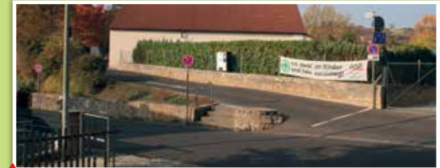
1 Querung Steigstraße vom Katzengraben zur Heide

Straßenüberquerung ohne Gehsteige Vorsicht, viel Verkehr und keine Gehsteige! Nur wenn die Straße ganz frei von Fahrzeugen ist, darfst du loslaufen!