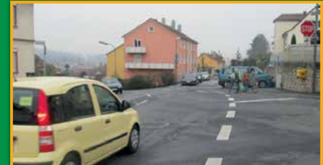
1 Scharoldstraße – Lindleinstraße: mehrere unübersichtliche Einmündungen, kein Zebrastreifen