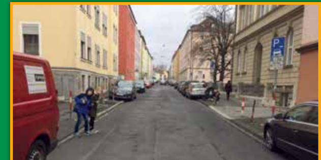
2 Steinheilstraße: Eingeschränkte Sicht durch parkende Autos, kein Zebrastreifen