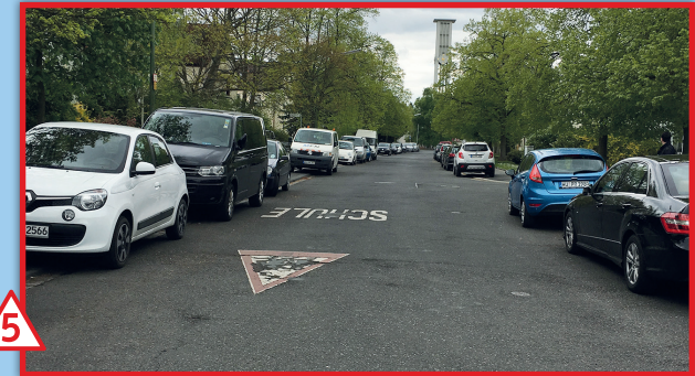
5 Stichstraßen der gesamten Cronthalstr. entlang: hohes Tempo, schlecht einsehbar/einschätzbar für Kinder • direkter Schulweg (= „Lot“ zum Schulhaus)