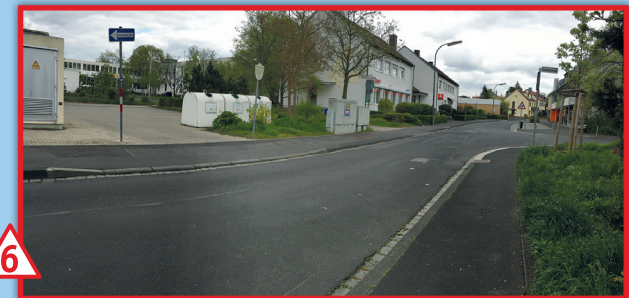
6 Ausfahrt Eltern-Parkplatz /Lehrer-Parkplatz: Kettlersstraße trifft direkt auf die Hans-Löffler-Str. und leicht kurvig mündet die Cronthalstraße ein + weitere Parkplätze vor Geschäften („der Gartenstadt“: Bäckerei usw.) • verkehrsreich, oft zu hohes Tempo