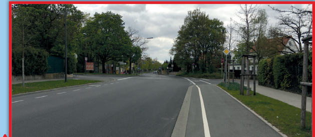
2 Keesburgstr., Trautenauerstr., Sanderrothstraße, Sanderheinrichsleitenweg