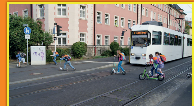
7 Friedrich-Spee-Str. – Fechenbachstr.: Einbahnstraße, jedoch Straßenbahnverkehr von beiden Seiten