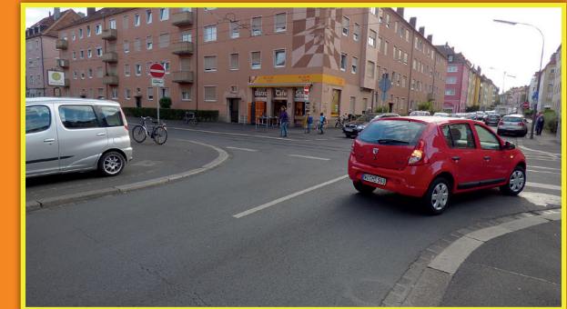
4 Friedrich-Spee-Str. – Arndtstr.: unübersichtlicher Übergang durch parkende Fahrzeuge am Müller-Bäck und Straßenbahnverkehr