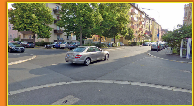
5 Arndtstraße – Umlandstraße – Platenstraße: gefährliche Kreuzung