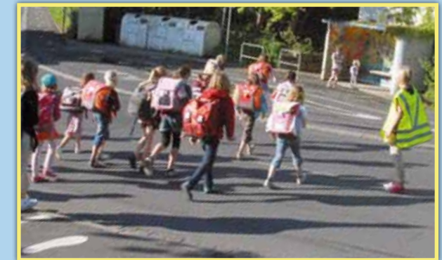
1 Straßenquerung vor der Schule mit Lotsendienst vor Schulbeginn