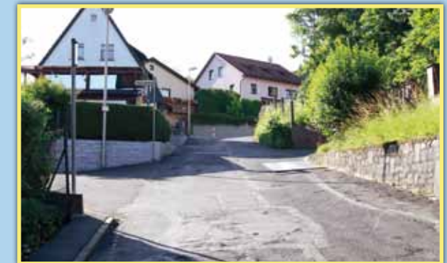
2 Schulweg ohne Gehsteig im Albertsleitenweg