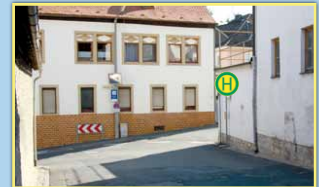
3 Bushaltestelle Oberhofstraße - Oberdürrbach, kein Gehsteig, abbiegender Verkehr, Engstelle