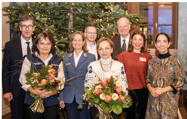
Bürgerpreisverleihung im Ratssaal

„Sie stehen exemplarisch für die bewundernswerte Tapferkeit der hunderttausenden Frauen, die allein, mit ihren Kindern oder betagten Eltern vor dem russischen Angriffskrieg aus der Ukraine fliehen und Freund oder Partner dort zurücklassen mussten. Dem nationalen Egoismus, dem chauvinistischen Hass, setzen Sie die völkerverbindende Kraft der Musik entgegen. Und Sie zeigen, wie wichtig kulturelles Schaffen und Erleben gerade in Zeiten wie diesen sind, um all das Schwere ertragen und verarbeiten zu können. Vielen Dank dafür! Ich freue mich sehr, dass Sie heute hier sind und damit auch die neuen Bürger und Bürgerinnen unserer Stadt vertreten.“ Die Gäste waren von der musikalischen Darbietung tief beeindruckt und spendeten begeistert Beifall. Ein großer Erfolg und ein schönes Erlebnis für die Chormitglieder.