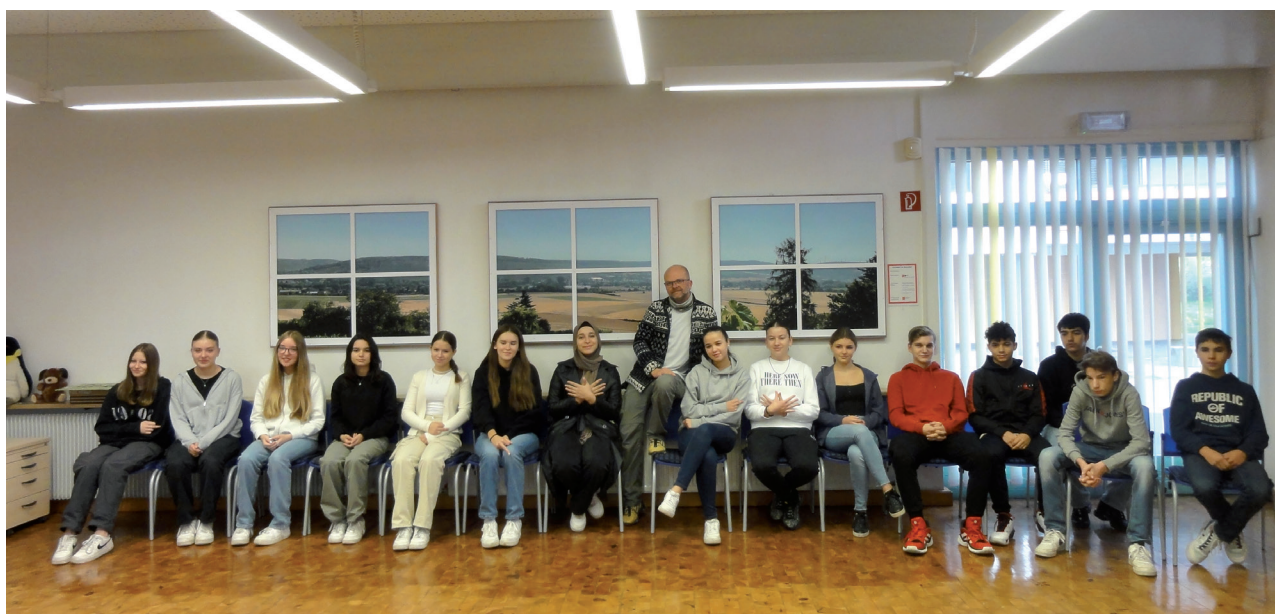
Kunstklasse M9A Mittelschule Heuchelhof