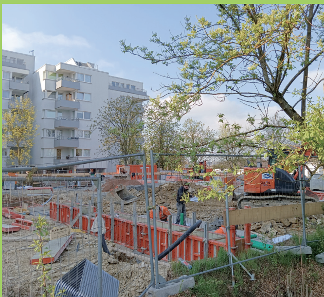
Neubau Kindergarten am Straßburger Ring