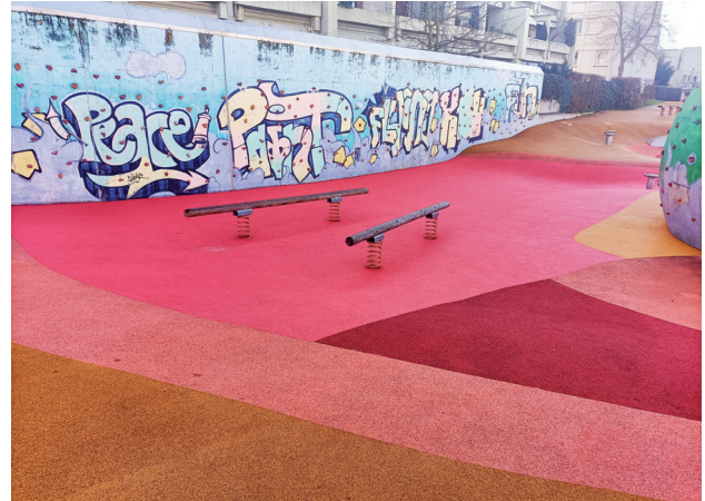
Neue Tampenbrücke und neuer Belag

Das Bewegungsfeld erfreut sich seit nunmehr zwölf Jahren großer Beliebtheit und ist sehr gut besucht von spielenden Kindern unterschiedlicher Altersgruppen. Es ist ein besonderes Freizeitangebot auf etwa 1.500 Quadratmetern mit einer Vielzahl an Spielgeräten und Klettermöglichkeiten.