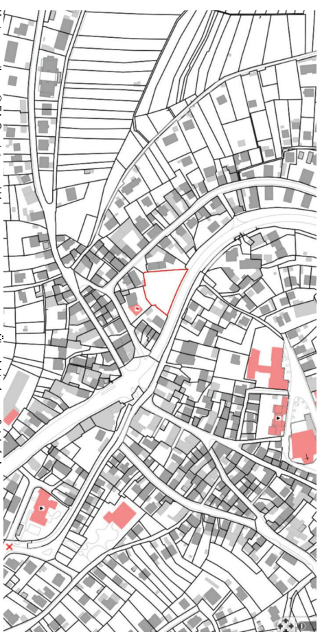
Kartengrundlage: © FA Geodaten und Vermessung Übersichtsplan maßstabstreu