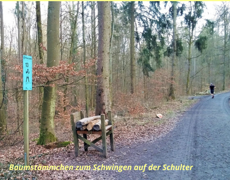
Baumstämmchen zum Schwingen auf der Schulter