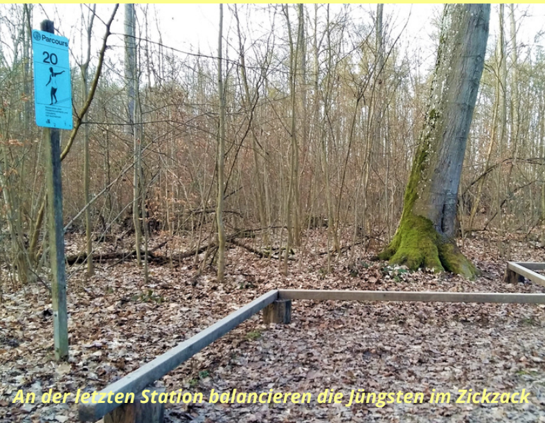
An der letzten Station balancieren die Jüngsten im Zickzack