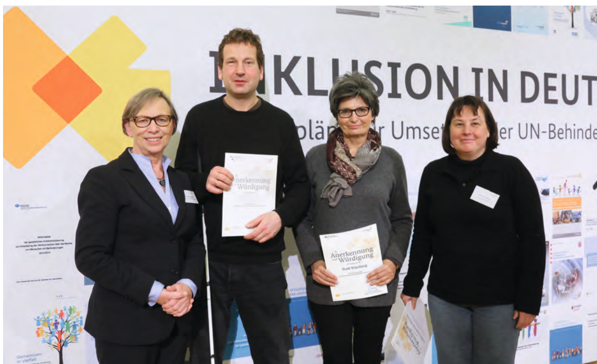
Anerkennung und Würdigung des Engagements der Stadt Würzburg für den Aktionsplan zur Umsetzung der UN-Behindertenrechtskonvention durch das Bundesministerium für Arbeit und Soziales.